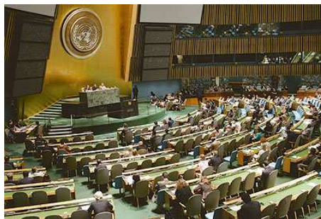
L'Assemblée générale de l'ONU

Le caractère criminel de l'emploi de l'arme nucléaire a été clairement dénoncé par la résolution de l'ONU du 24 novembre 1961. L'Assemblée Générale déclare : « Tout État qui emploie des armes nucléaires et thermonucléaires doit être considéré comme violant la Charte des Nations Unies, agissant au mépris des lois de l'Humanité et commettant un crime contre l'Humanité et la civilisation. » Vous conviendrez que la condamnation est sans appel. Face à la possibilité du crime nucléaire, l'humanité est sommée de se réveiller de son inconscience et de résister à sa barbarie intérieure. L'humanité, c'est-à-dire chacun de nous. Dès lors, ne sommes-nous pas mis au défi de défendre l'Humanité et la civilisation contre le crime nucléaire ?