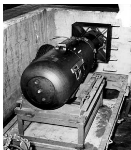
« Little Boy »

Alors que d'aucuns sont portés à laisser croire que le renoncement à l'arme nucléaire porterait atteinte à la « grandeur de la France », c'est probablement tout le contraire qui se produirait. Comment ne pas croire en effet qu'il en résulterait un surcroît de prestige pour notre pays ? « Le prestige, déclarait M. Ban Ki-moon, le Secrétaire général des Nations Unies, lors de l'allocution qu'il prononça à Hiroshima le 6 août 2010, appartient non pas à ceux qui possèdent des armes nucléaires, mais à ceux qui y renoncent. » Sans nul doute la capacité de notre pays de faire entendre sa voix dans les grands débats de la politique internationale ne serait non pas affaiblie mais renforcée. On peut gager que partout dans le monde des femmes et des hommes salueraient la décision de la France comme un acte de courage qui leur redonne un peu d'espérance.